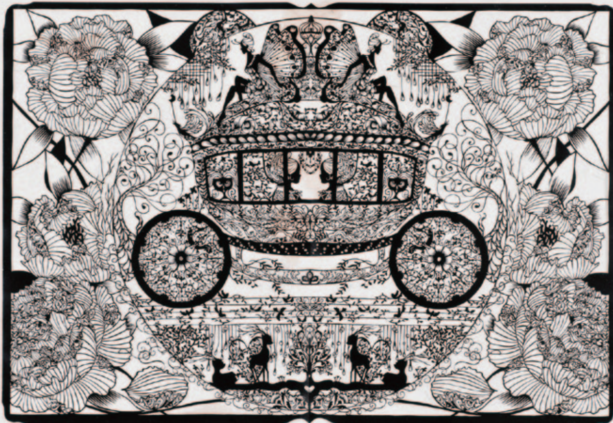
ファンタスティック馬車